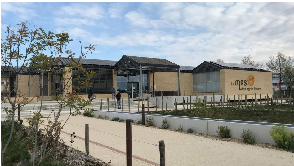
Le Mas des Agriculteurs vu de l'extérieur

Pour plus d'informations sur le Mas des agriculteurs, rendez-vous sur le site lemasdesagriculteurs.fr ( cliquer ICI ) et la page Facebook ( cliquer ICI ). Le Mas des agriculteurs. 581 rue Michel Debré 30 000 Nîmes.